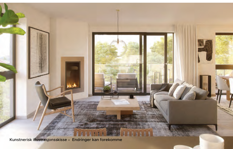
Kunstnerisk illustrasjonsskisse • Endringer kan forekomme