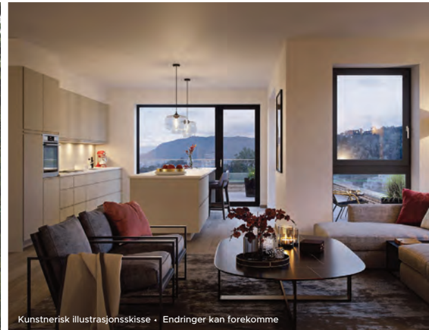
Kunstnerisk illustrasjonsskisse • Endringer kan forekomme