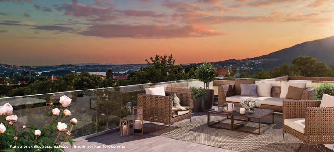
Kunstnerisk illustrasjonsskisse • Endringer kan forekomme