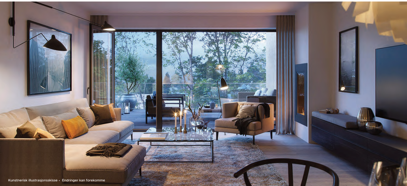
Kunstnerisk illustrasjonsskisse • Endringer kan forekomme

Priser fra kr 2.220.000,- til 15.900.000,-