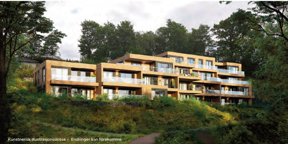
Kunstnerisk illustrasjonsskisse • Endringer kan forekomme

Selskapene har sunn økonomi og solide eiere.