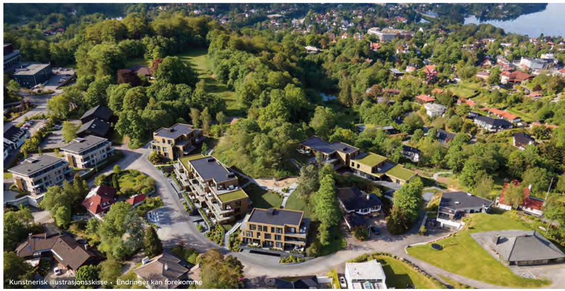
Kunstnerisk illustrasjonsskisse • Endringer kan forekomme